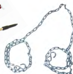
SR202 Kedja 2,5 m med krok